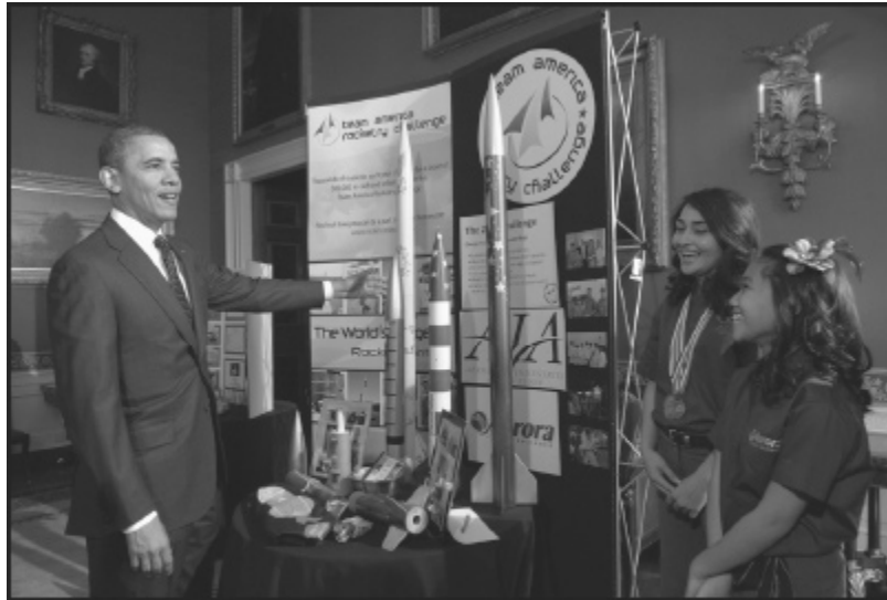
El presidente Obama habla con estudiantes de la maestra Condino.