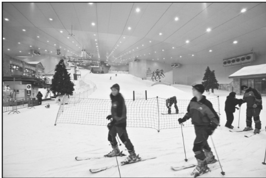
Esquiadores en Ski Dubai