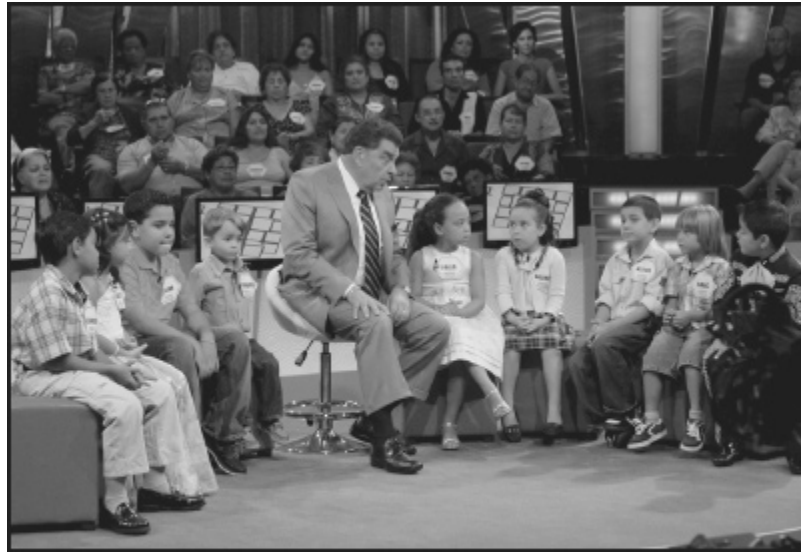
Don Francisco durante la grabación de un programa